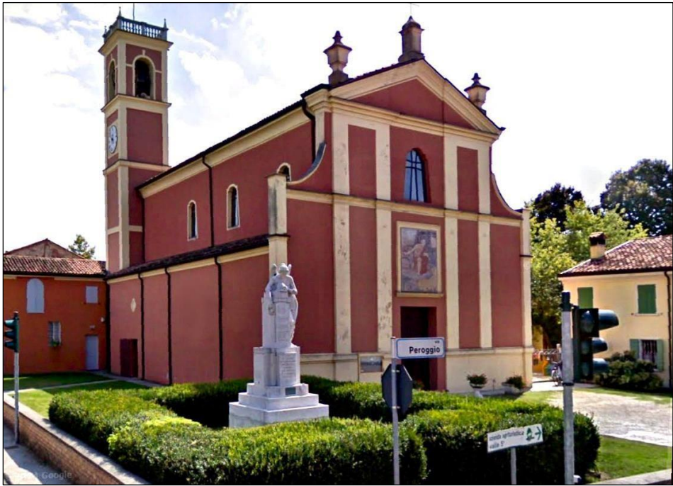
Chiesa Parrocchiale di San Girolamo